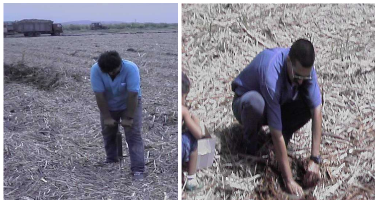
Fotos No. 2 y 3. Toma de muestras de suelo y obtención de la resistencia a la penetración del suelo

Los tratamientos se escogieron de forma que permitiera obtener el incremento de la compactación del suelo a medida que aumenta el tránsito de los equipos. Los datos de la resistencia a la penetración del suelo se tomaron inmediatamente después del tránsito, a una profundidad de 150 mm.