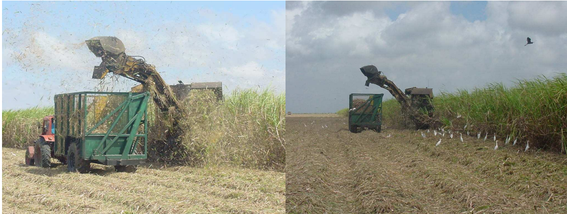
Foto No.1 y No.2 Semirremolque autobasculante trabajando durante las pruebas.

La presión media específica con el remolque cargado, fue de 127 kPa, menor que la recomendada por Dick (1987). Además si se compara con la presión sobre el suelo de los demás medios de transporte empleados en Cuba, Gráfico No. 1 se comprueba que es muy inferior a los demás remolques cañeros. El incremento de 850 kg en el puente trasero del tractor MTZ 80, solo eleva su presión sobre el suelo hasta 130 kPa, lo que no representa un incremento significativo.