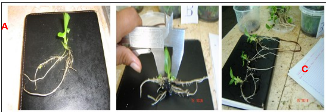
Figura: A Longitud de las raíces; B - Diámetro del seudo tallo C- Número de raíces

Jó María y col ( 2005 y 2006) señala que se encontraron respuestas fisiológicas en la fase de enraizamiento en la micropropagación del plátano FIAH 18 en la Biofábrica de Pinar del Río, utilizando diferentes concentraciones de MS adicionando 20 y 40 mL/L del extracto de Aloe vera.